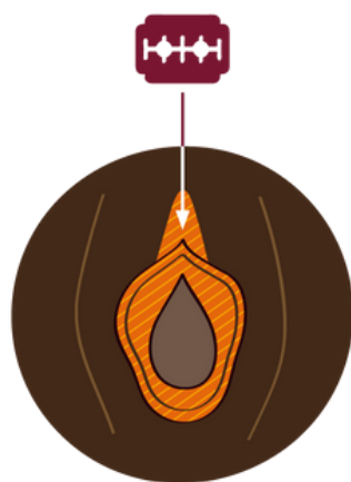
TYP 2 Exzision