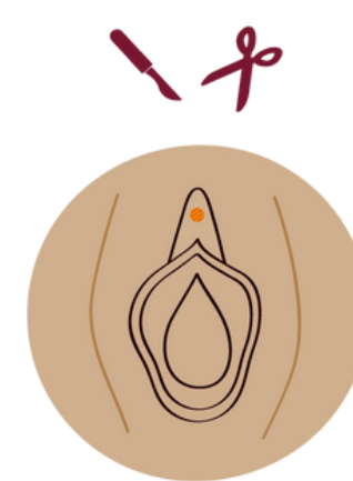
TYP 4 Variationen – alle anderen Eingriffe, bei denen die äußeren Geschlechtsorgane aus nichtmedizinischen Gründen entfernt oder verletzt werden